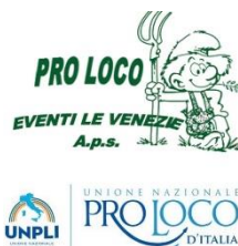
PRO LOCO EVENTI LE VENEZIE APS