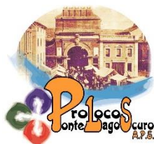
PRO LOCO PONTELAGOSCURO APS