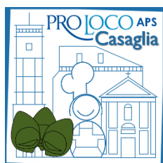
PRO LOCO CASAGLIA APS

Dalle acque alle terre con bonifiche e canali